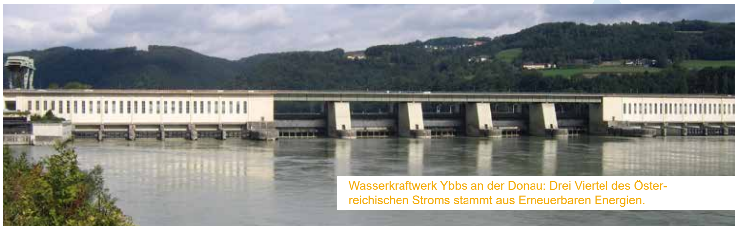
Wasserkraftwerk Ybbs an der Donau: Drei Viertel des Österreichischen Stroms stammt aus Erneuerbaren Energien.

Die Entzauberung und Entmystifizierung der Elektrizität und in weiterer Folge die Nutzbarmachung erfolgten erst zu Beginn des 18. Jahrhunderts, nachdem im 17. Jahrhundert sogenannte Elektrisierungsmaschinen in erster Linie der Belustigung