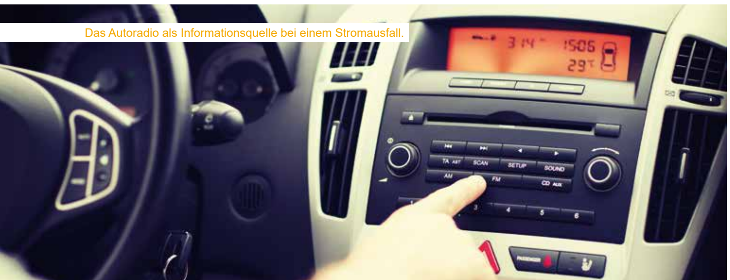
Das Autoradio als Informationsquelle bei einem Stromausfall.

Einen umfangreichen Überblick über alle empfohlenen Maßnahmen bietet der Österreichische Zivilschutzverband in einer eigens dafür zusammengestellten Broschüre. Ebenfalls können Produkte im Webshop des Zivilschutzverbandes