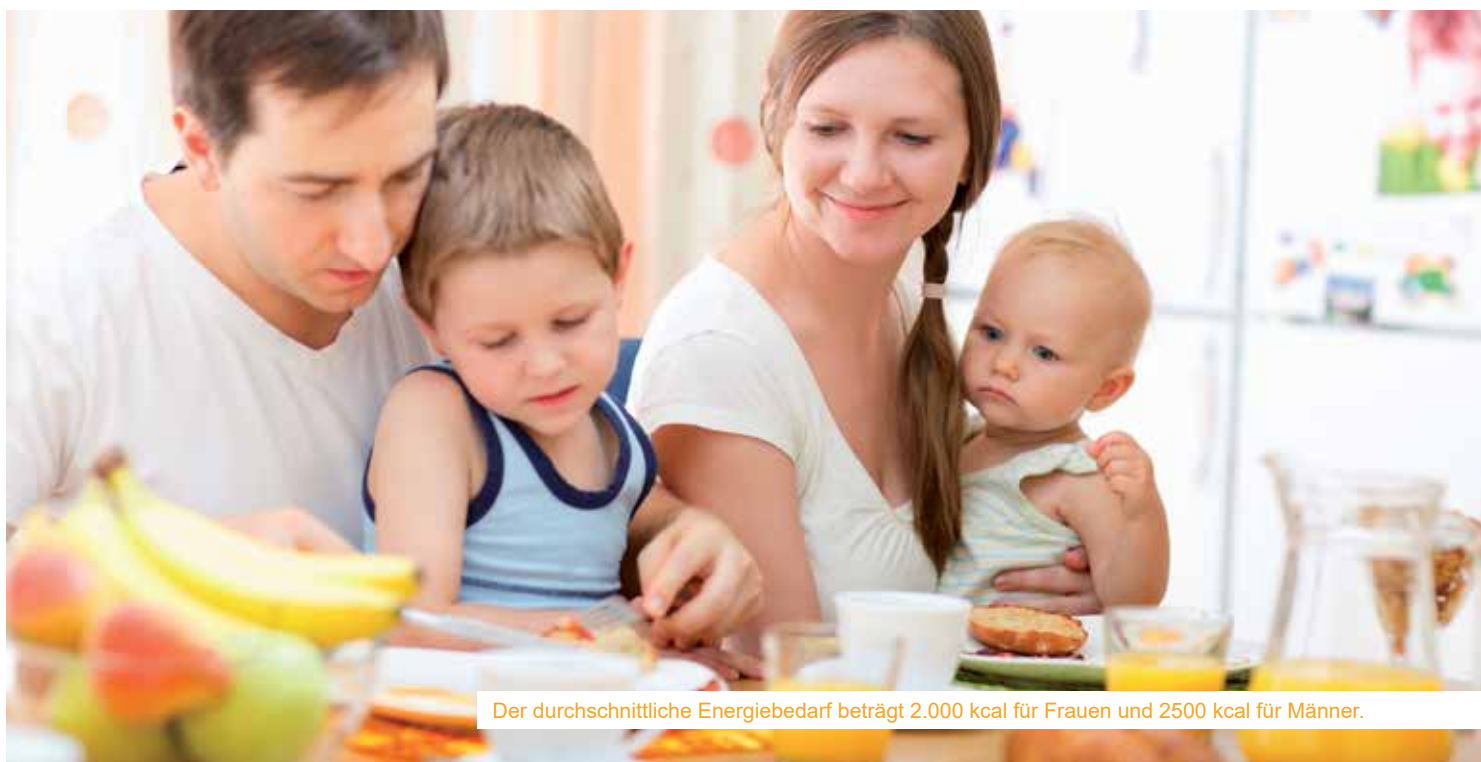
Der durchschnittliche Energiebedarf beträgt 2.000 kcal für Frauen und 2500 kcal für Männer.

Der Energiebedarf muss über die Nahrung abgedeckt werden. Unsere Nahrung entstammt hauptsächlich der Tier- und Pflanzenwelt und beinhaltet größtenteils Eiweiß, verschiedene Fette und Kohlenhydrate. Kohlenhydrate sind reine Energielieferanten und sollten rund 50 Prozent der gesamten Energiezufuhr ausmachen. Zu finden sind diese beispielsweise in Getreide, Getreideprodukten, Kartoffeln, Zucker und Obst. Die un-