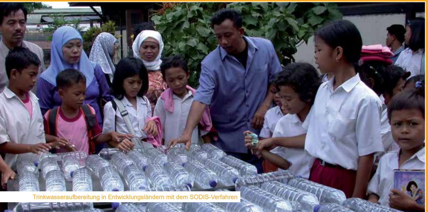
Trinkwasseraufbereitung in Entwicklungsländern mit dem SODIS-Verfahren